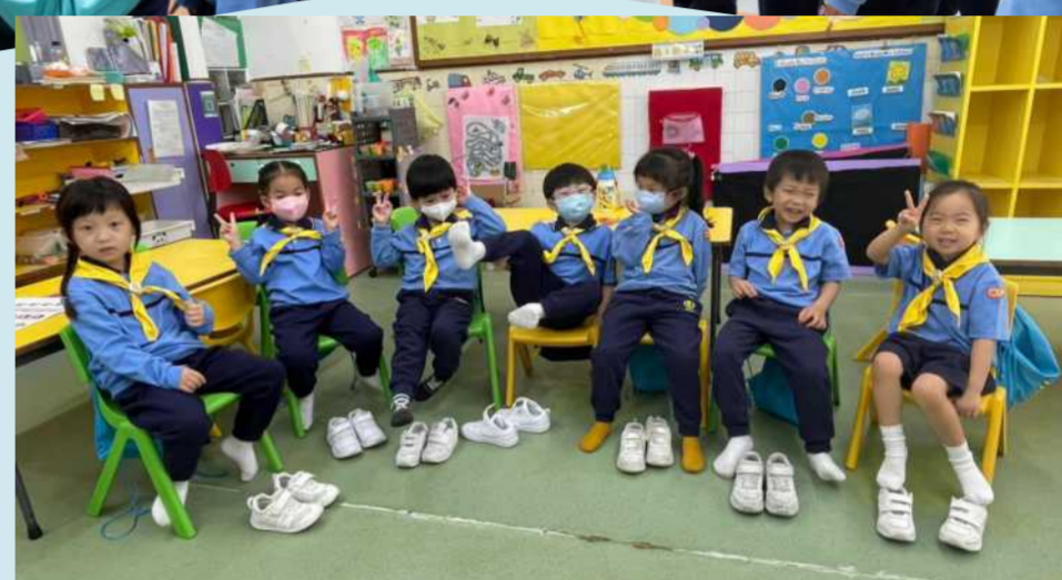
赤柱石澳長者鄰舍中心探訪活動