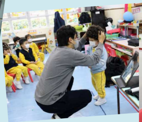
家長職業、寵物分享