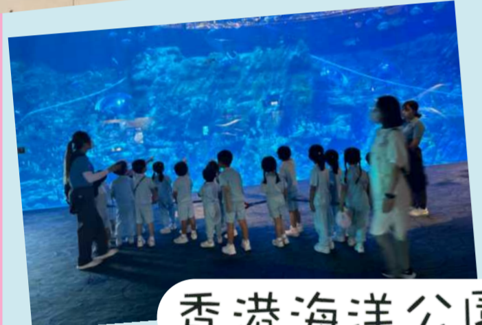
香港海洋公園-自然探索班