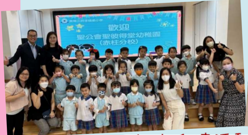
幼小銜接活動-小學體驗日 (東華三院李賜豪小學)