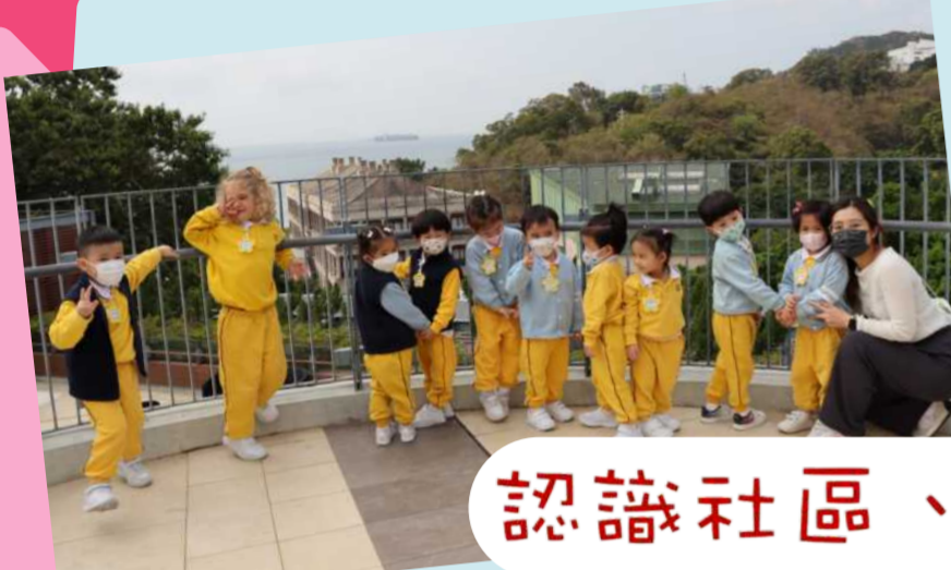
認識社區、交通工具