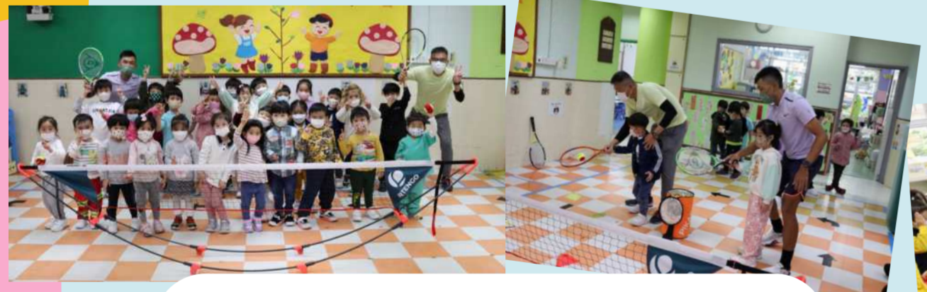
幼兒網球體驗(全日班)