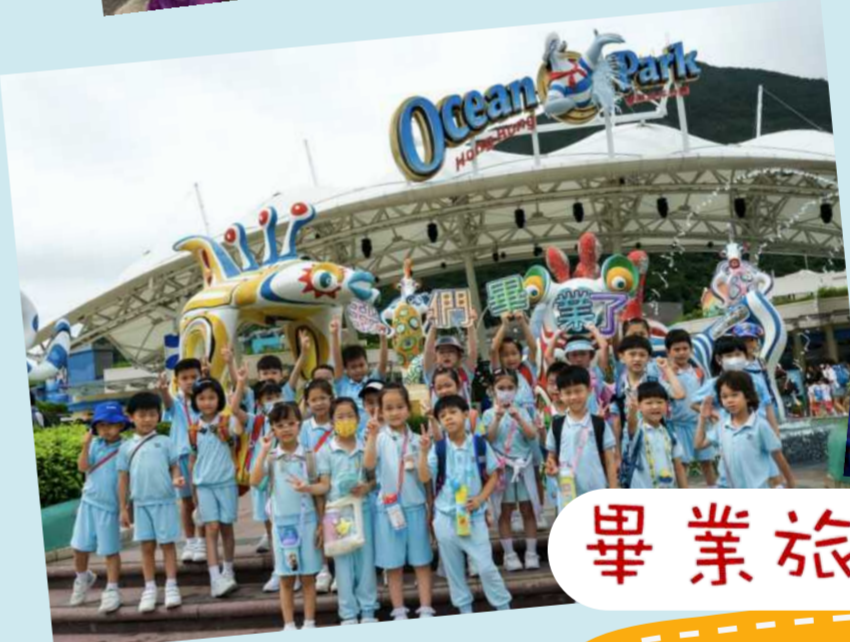
畢業旅行 - 海洋公園